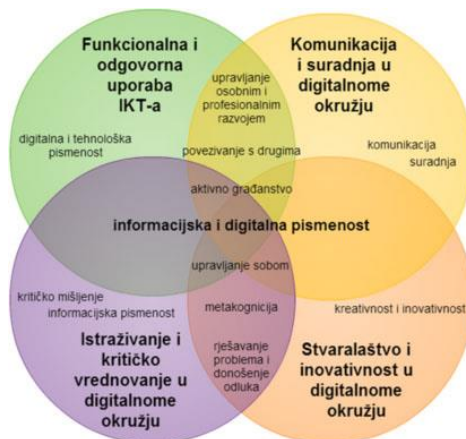
3. grafički prikaz: Uporaba informacijske i komunikacijske tehnologije i temeljne kompetencije

Osobito se preporučuje poticati uključivanje učenika iz osnovne i srednje škole u različite školske, lokalne, nacionalne i međunarodne projekte koji se odvijaju u virtualnome okružju, a u kojima će biti formirane heterogene skupine učenika (različite dobi, prethodnih iskustava učenja, interesa i sl.). Na taj će se način učenike vertikalno povezivati sukladno njihovim interesima.