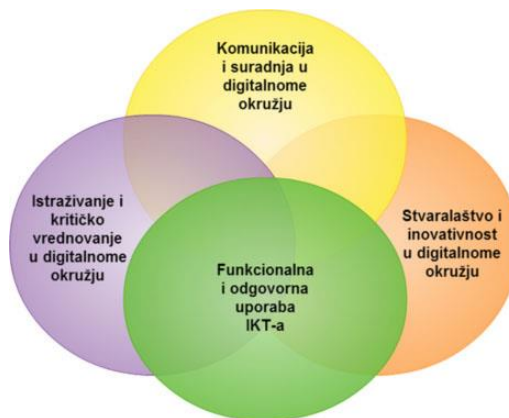
1. grafički prikaz: Struktura međupredmetne teme Uporaba informacijske i komunikacijske tehnologije