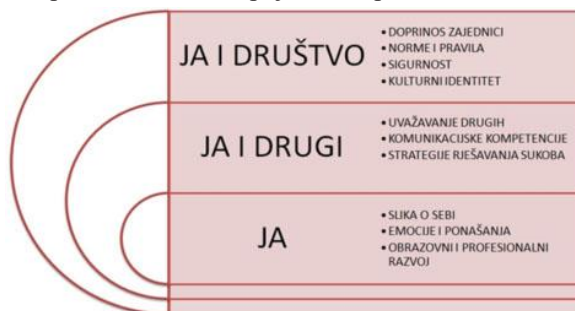
2. slika: Grafički prikaz domena u međupredmetnoj temi Osobni i socijalni razvoj

Razvijanje kritičkog odnosa prema društvenim pojavama i procesima