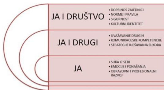
Grafički prikaz domena u međupredmetnoj temi Osobni i socijalni razvoj