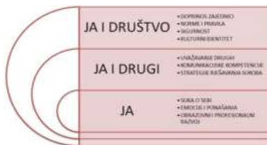
Grafički prikaz domena u međupredmetnoj temi Osobni i socijalni razvoj