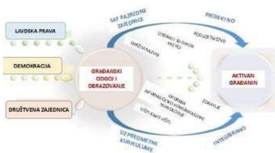
Shematski prikaz Međupredmetne teme Građanski odgoj i obrazovanje

Građanski odgoj i obrazovanje obuhvaća znanja o pravima pojedinca, obilježjima demokratske zajednice i političkim sustavima. Učenik razvija kritičko mišljenje i komunikacijske vještine potrebne za društveno i političko djelovanje u svakidašnjem životu. Temeljne vrijednosti koje se promiču učenjem i poučavanjem Građanskog odgoja i obrazovanja su odgovornost, ljudsko dostojanstvo, sloboda, ravnopravnost i solidarnost. Osobita važnost pridaje se razvoju odgovornog odnosa prema javnim dobrima kao i spremnosti pojedinca da doprinosi širenju, razvoju i održavanju zajedničkih javnih dobara.