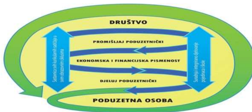
Prikaz domena u međupredmetnoj temi Poduzetništvo

Svrha učenja i poučavanja ove međupredmetne teme je razvijanje poduzetničkoga načina promišljanja i djelovanja u svakodnevnom životu i radu.